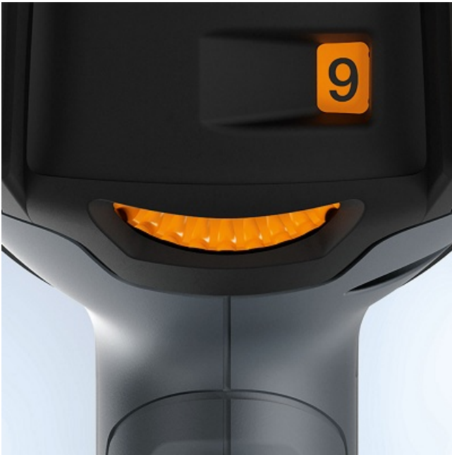
Inel de agatare