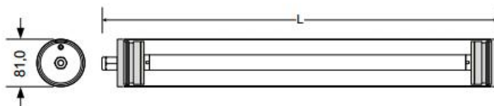
TR3 T8 1 TUBO / 2 TUBOS