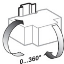
Instalare în orice poziție.