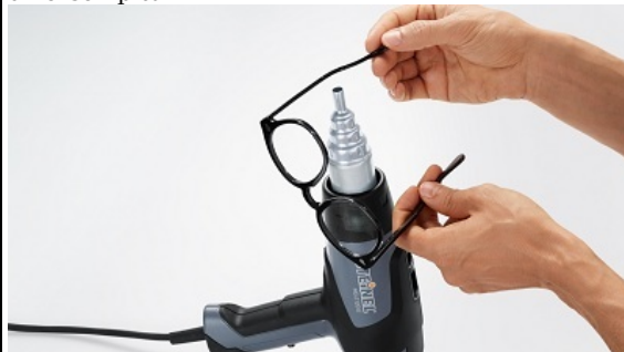
Principalele avantaje Greutate echilibrata, balansata