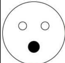
3P+N+PE ora 6 -6H